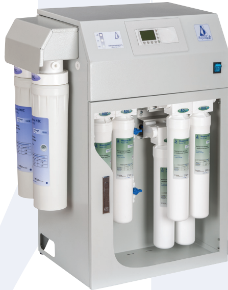
Блок обессоливания -2 Double