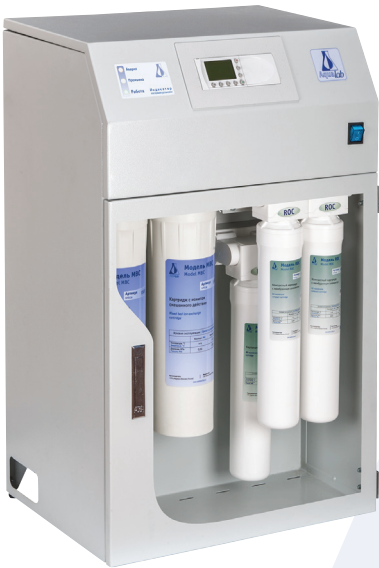
Блок обессоливания AL-1 Double