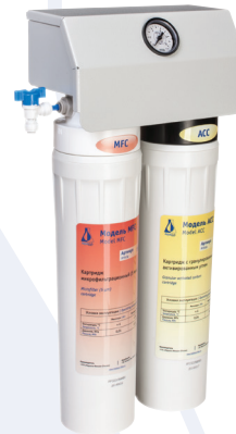
Блок предварительной очистки PTS-4 в комплекте